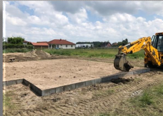
Lábazati zsalukő építése

1 sor 20-as zsalukő 1 db 10-es betonvassal vízszintes és függőleges vasalással. Lábazatra 5 cm XPS lábazati szigetelés. Lábazat feltöltése homokkal.